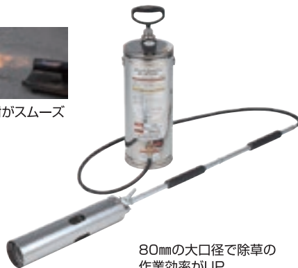
80mmの大口径で除草の 作業効率がUP