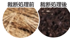
裁断処理前 裁断処理後